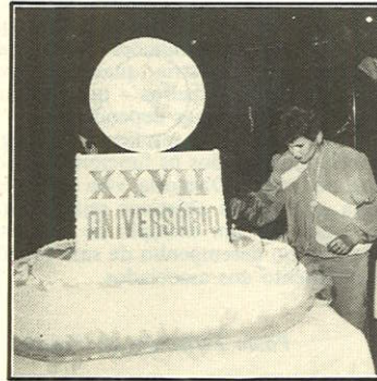
Nossa primeira-dama cortou o bolo de aniversário.