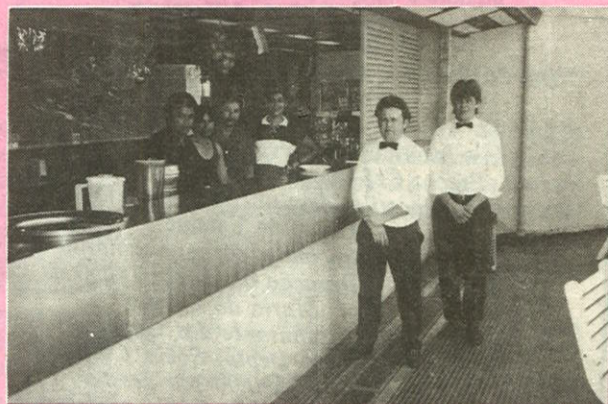
No Bar do Tênis, todos a postos para mais um domingo de sol