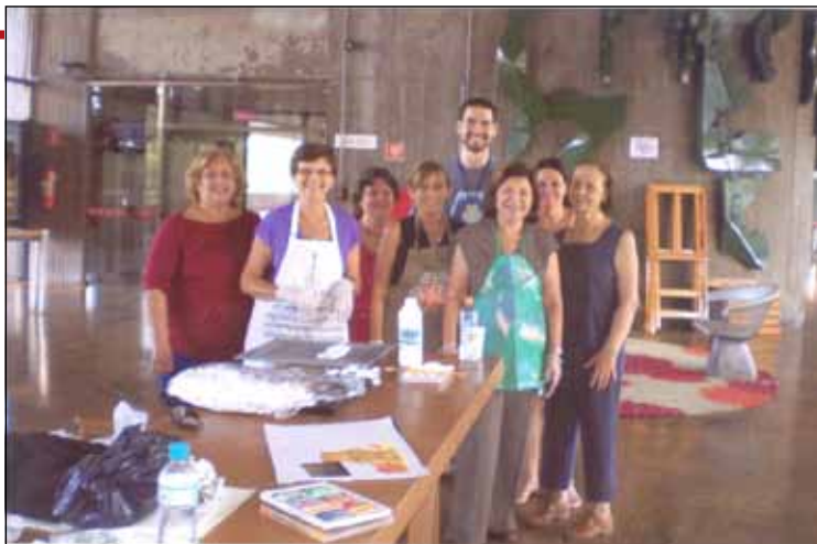
As alunas também pintaram durante a exposição

Parabéns a todas por essa exposição que foi um sucesso.