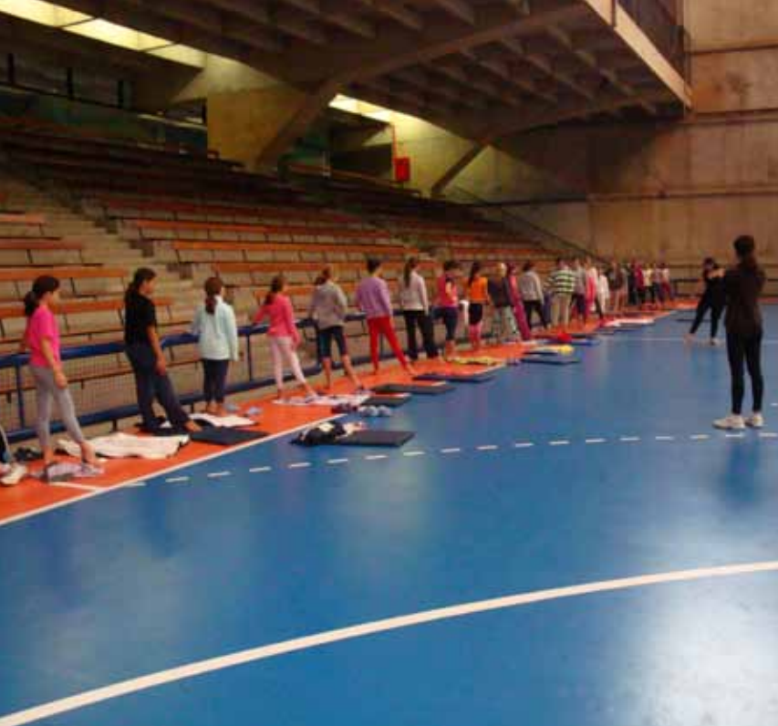
A habilidade das atletas dentro e fora da água

Parabéns a equipe técnica pela ação e às nossas atletas que não medem esforços para subirem ao podium.