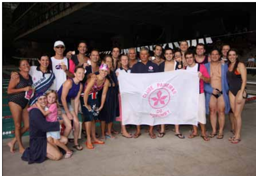
Equipe Campeã da 1ª Etapa Paulista Master de Natação