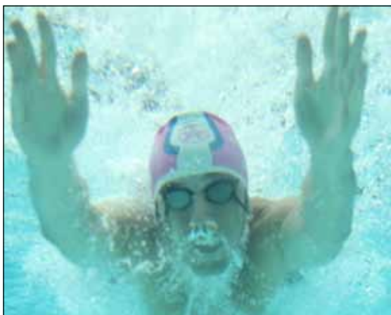
Rumo ao Pentacampeonato