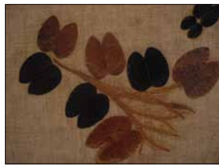
Anita Colli - Pata de Vaca - Técnica Acrílica e colagem sobre a tela