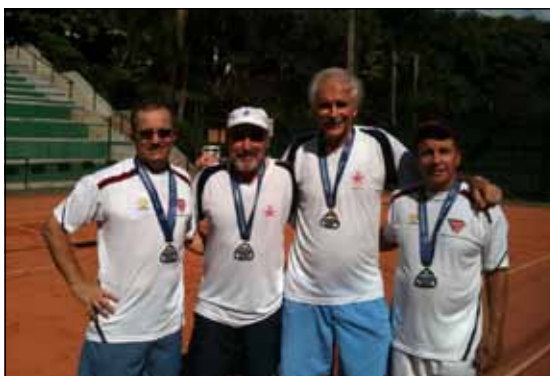
Mais um título conquistado

Parabéns aos nossos atletas pelo primeiro título do ano junto a Federação Paulista de Tênis e desejamos bastante energia para os próximos confrontos.