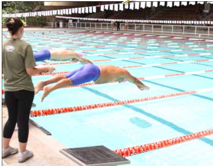
Copa Paineiras de Natação Master

Veja o resultado completo da participação dos atletas do Clube no portal do Paineiras.