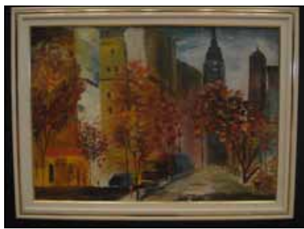
Lysis de Bertanzos - Metrópole - Técnica Óleo sobre a tela