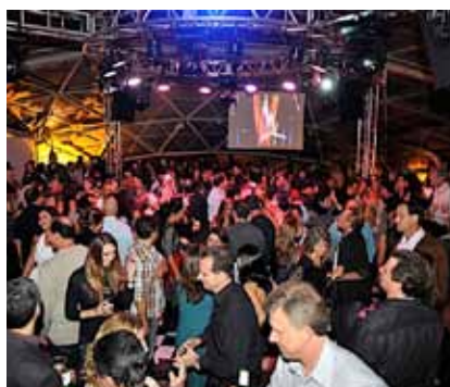
Diversos ambientes sofisticados