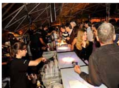
O sucesso do Bar Disco