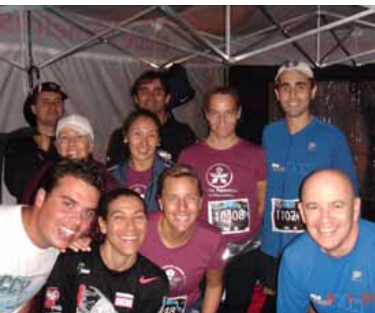
Os corredores do SCORP