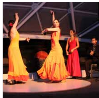
Um baile flamenco