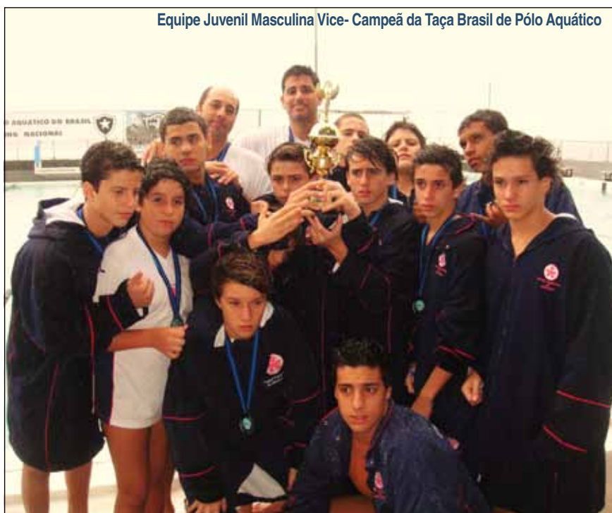
Equipe Juvenil Masculina Vice- Campeã da Taça Brasil de Pólo Aquático