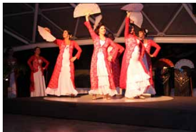
Uma Sexta Dançante com um cenário espanhol