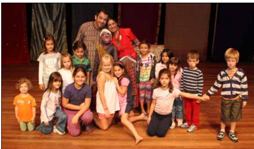
As crianças adoraram a peça

Assim, através da dança clássica indiana, os personagens Krishna, Ganesha, Shiva são apresentados ao público de forma descontraída e bem humorada, com bonecos e atores.