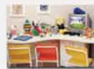
Centro da Criança

Av. Dr. Guilherme Dumont Villares, 1230 – 8º andar Morumbi - Estacionamento Próprio 3772-5292