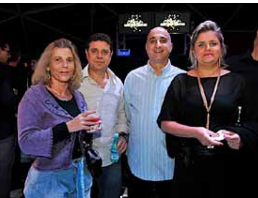
Ótimo lugar para reunir os amigos e badalar