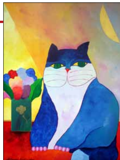
Gato Azul com Flores e Lua

Nos desenhos de cangaceiros, nos seus peixes, galos, cavalos, nas paisagens, frutas e até na sua série de gatos, transparece uma brasilidade sem culpa que extrapola o eixo temático e alcança as cores, as luzes, os traços e telas de uma cultura.