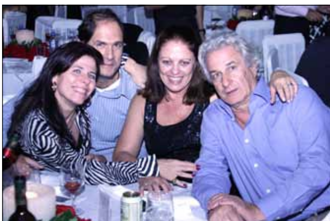
As sextas dançantes são um ótimo lugar para reunir os amigos