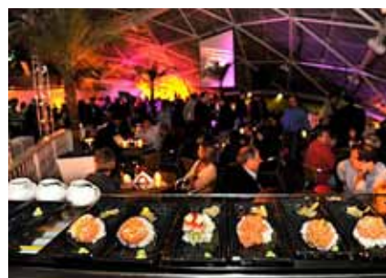
O toque gastronômico da disco ASIA 70