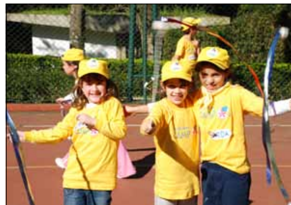
2ª Temporada do 57º Paineiras Camp

No evento, todas as crianças terão café da manhã, almoço e lanche da tarde, além de brindes.