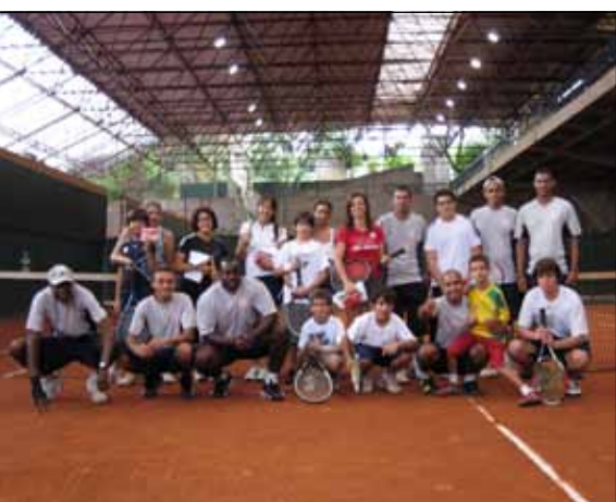
A clínica contou com a participação dos professores do Tênis Recreativo