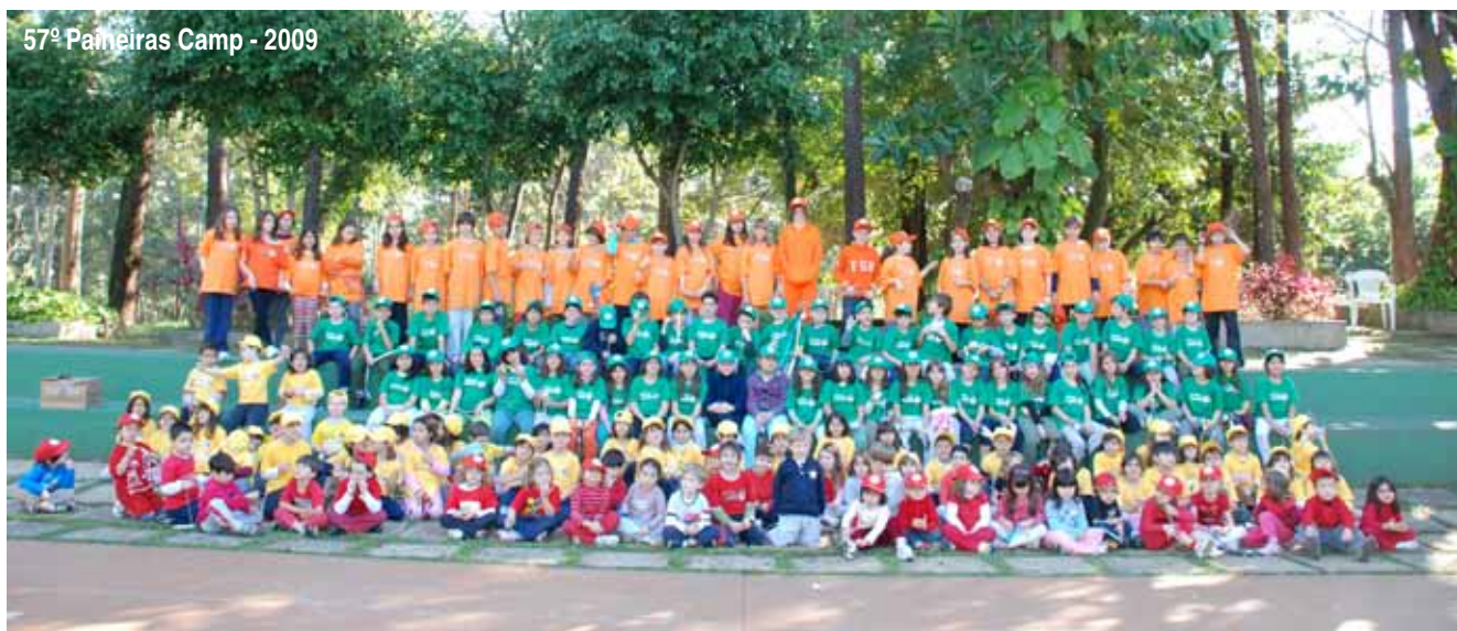
57º Paineiras Camp - 2009

As inscrições já estão abertas na Central de Atendimento (CAT). As vagas são limitadas e serão preenchidas por ordem de chegada. O valor da inscrição é de R$ 330 para sócios; R$ 594, dois irmãos; R$ 814, três irmãos; R$ 594, não sócio (apresentado); e R$ 297 para sócios que participaram em julho de 2009.