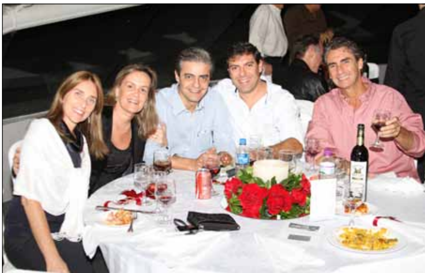
A Noite Espanhola uniu gastronomia e dança