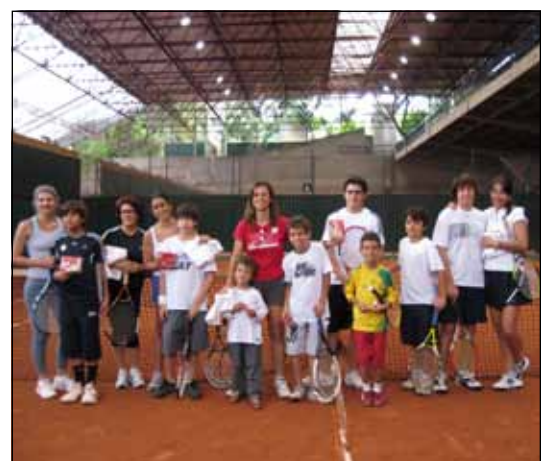
Todos os participantes ganharam brindes e chocolates Nestlé

Parabéns à todas as mães e filhos pela participação no evento que foi um sucesso.