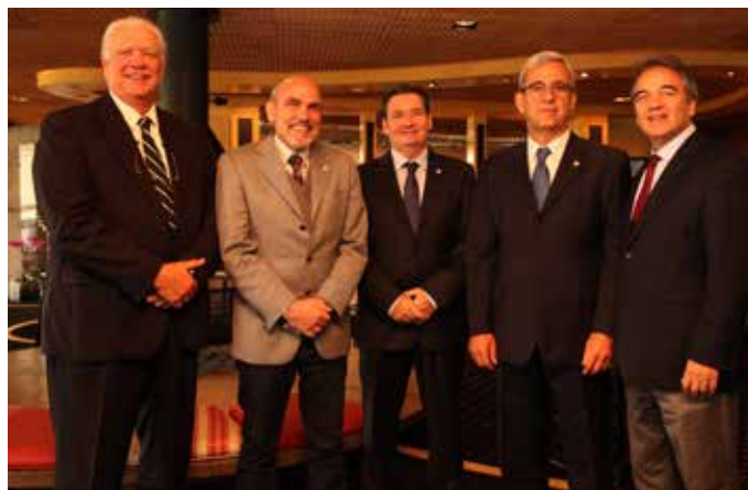
Diretoria Executiva 2013-2015