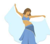
DANÇA DO VENTRE