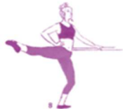
BALLET FULL BODY