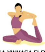
YOGA VINYASA FLOW E YOGA KURUNTA FLOW