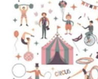
OFICINA DE CIRCO