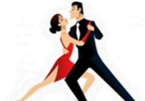
DANÇA DE SALÃO