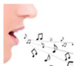
OFICINA DE TÉCNICAS DE EXPRESSÃO VOCAL