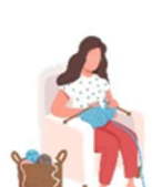
TRICÔ E CROCHÊ