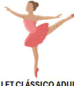
BALLET CLÁSSICO ADULTO E INFANTO-JUVENIL