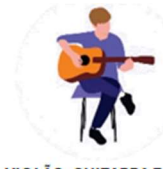
VIOLÃO, GUITARRA E CONTRABAIXO