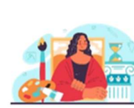
HISTÓRIA DA ARTE