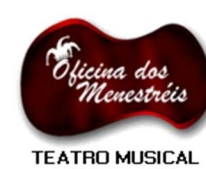
TEATRO MUSICAL OFICINA DOS MENESTREIS