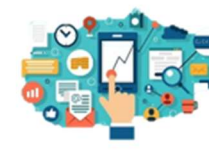
OFICINA DE INCLUSÃO DIGITAL