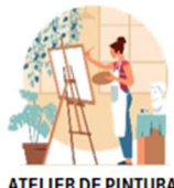
ATELIER DE PINTURA E TÉCNICAS VARIADAS