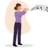
FLAUTA DOCE E TRANSVERSAL